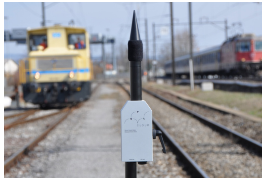
Das Messgerät zeichnet Werte von 20dB bis 130 dB auf und sendet diese via GSM/3G/LTE